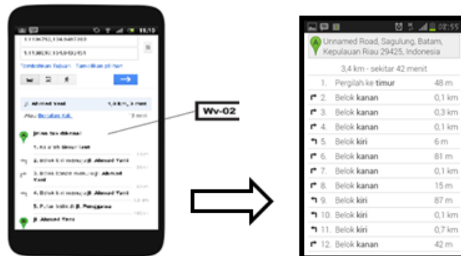
Gambar 4 Tampilan frame lihat informasi rute perjalanan

Pada frame lihat informasi rute perjalanan (Gambar 4), pengguna akan mendapatkan informasi rute, waktu perjalanan, dan jarak dari pengguna ke pantai berdasarkan posisi pengguna saat itu terhadap lokasi pantai yang akan dituju. Titik lokasi pengguna diketahui dengan menggunakan GPS.