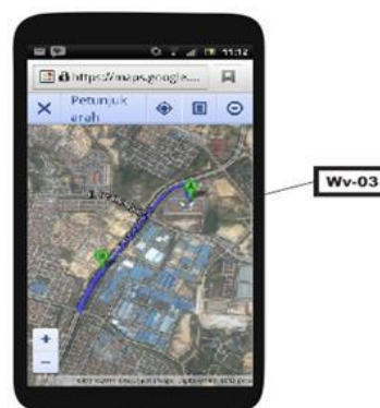
Gambar 5 Tampilan frame lihat rute jalan