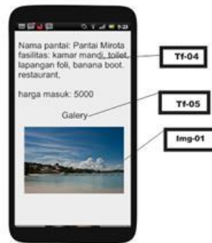
Gambar 3 Tampilan frame informasi pantai

Frame informasi pantai (Gambar 3) akan memberikan informasi pantai, yaitu nama pantai, fasilitas, harga tiket masuk, dan foto-foto pantai yang dituju.